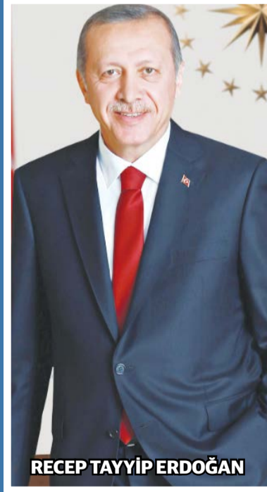
RECEP TAYYİP ERDOĞAN

Cumhurbaşkanı Recep Tayyip Erdoğan, çeşitli açılışlara ve 8. İl Kongresine katılmak üzere bugün Gaziantep'e geliyor. Cumhurbaşkanı Recep Tayyip Erdoğan'ın çeşitli açılışlara ve 8. İl Kongresine katılmak üzere Gaziantep'e gelecek olması dolayısıyla AK Parti Gaziantep teşkilatlarında heyecan doruğa çıktı.