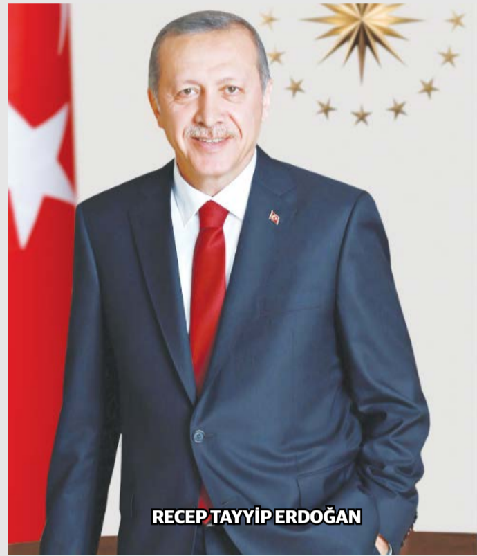
RECEP TAYYİP ERDOĞAN

Cumhurbaşkanı Recep Tayyip Erdoğan, çeşitli açılışlara ve 8. İl Kongresine katılmak üzere bugün Gaziantep'e geliyor.