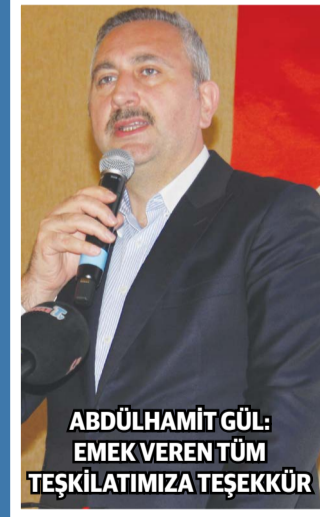
ABDÜLHAMİT GÜL: EMEĞ VERENTÜM TEŞKİLATIMIZA TEŞEKKÜR

İlk önce 13:30'da Güneyşehirde 5 bin 113 Deprem ve Sosyal Konut Anahtar ve Tapu Teslim Törenine katılacak olan Cumhurbaşkanı Recep Tayyip Erdoğan, sonrasında 15:30'da İl Kongresine geçecek. Daha sonra ise akşam 17:30'da Şahinbey Millet Kütüphanesi'nde gerçekleştirilecek 'Gençlik Buluşmaları' kapsamında gençlerle bir araya gelecek. ● SAYFA 4'TE