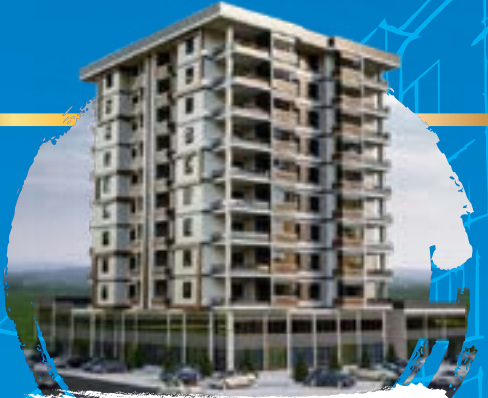
Rümeysa park sitesi Fıstıklıgın zirvesinde