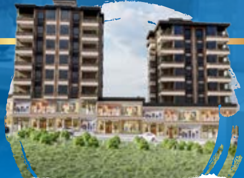
Güzelvadi sitesi Vadi manzaralı lüks daireler