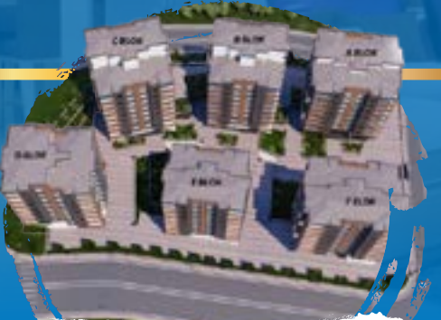
Ayıntap park sitesi Beştepenin zirvesinde