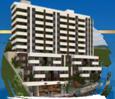
Gölpark sitesi vadi manzaralı