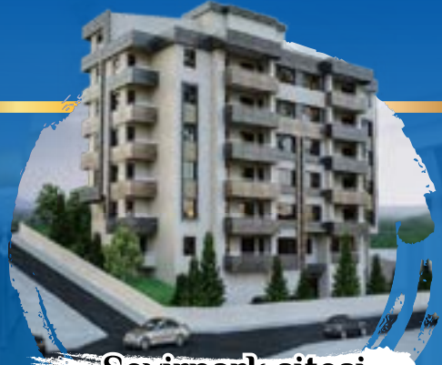
Seyirpark sitesi İbrahimlinin zirvesinde lüks 3+1 daireler