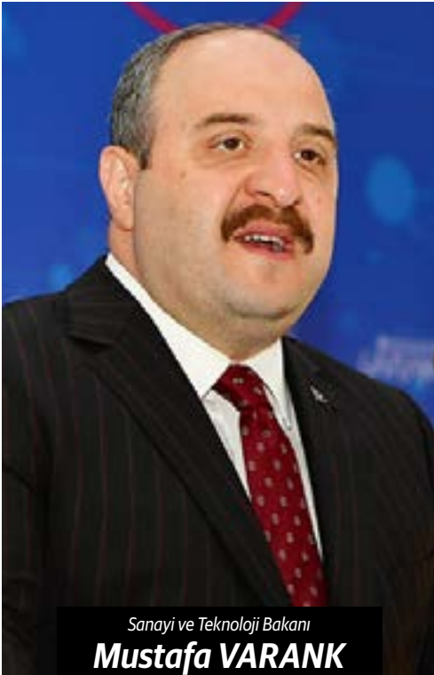
Sanayi ve Teknoloji Bakanı Mustafa VARANK

Gaziantep'te, Sanayi ve Teknoloji Bakanlığı'nca desteklenen 8 projenin toplu açılışı, Sanayi ve Teknoloji Bakanı Mustafa Varank'ın katılımı ile gerçekleştirildi.