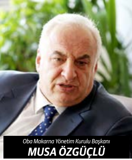
Oba Makarna Yönetim Kurulu Başkanı

Oba Makarna, konteyner krizinin lojistikte yarattığı darboğazı aşmak için kendi armatörlük şirketini kurdu.