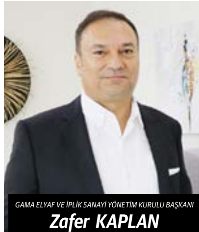
GAMA ELYAF VE İPLİK SANAYİ YÖNETİM KURULU BAŞKANI

İTHAL ETTİĞİ KONFEKSİYON ATIKLARINI VE PET ŞİŞELERİ AYRIŞTIRDIKTAN SONRA ELYAF VE İPLİĞE DÖNÜŞTÜREREK YAKLAŞIK 40 ÜLKEYE İHRAÇ EDEN GAMA ELYAF VE İPLİK GELECEK YIL İTİBARIYLA ÜRETİM HACMİNİ 200 MİLYON DOLARA ULAŞTIRMAYI HEDEFLİYOR.