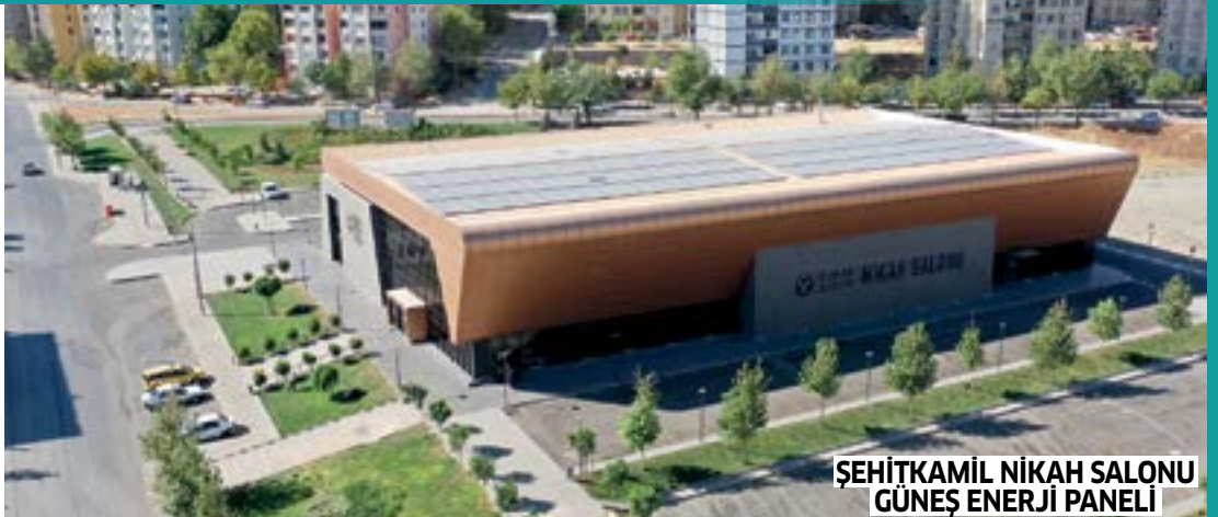
ŞEHİTKAMİL NİKAH SALONU GÜNEŞ ENERJİ PANELİ

Özellikle son dönemde fosil yakıtla çevreye verilen zararı minimum seviyeye indirmek ve belediyemizin kuruluş olarak yenilenebilir enerjide öncü olmasını sağlamak adına hizmet binalarımızın çatılarına güneş enerji panelleri yerleştiriyoruz. Böylelikle gerekli enerjiyi, doğaya ve ülke ekonomisine zarar vermeden elde etmiş oluyoruz."