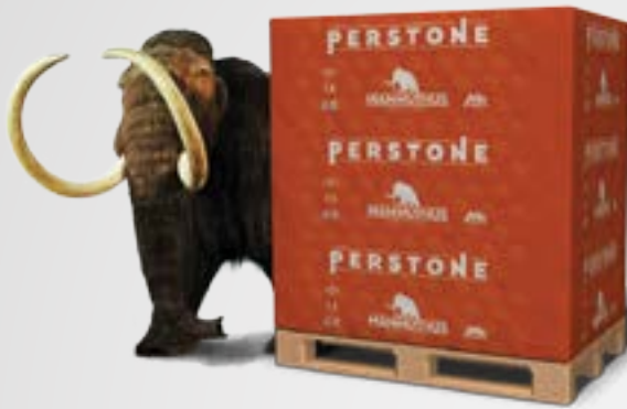
BLOK ve KAPLAMA