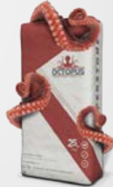
BLOK ve PANEL YAPIŞTIRICI