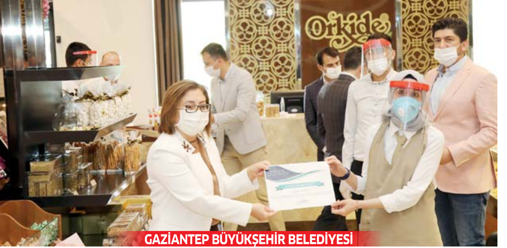
GAZİANTEP BÜYÜKŞEHİR BELEDİYESİ