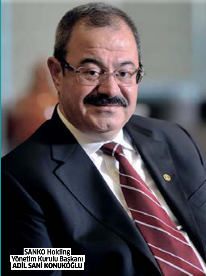
SANKO Holding Yönetim Kurulu Başkanı ADIL SANİ KONUKOĞLU

SANKO Holding Yönetim Kurulu Başkanı Adil Sani Konukoğlu, "Ülke olarak üretmek zorundayız. Üretmezsek başaramayız" dedi. Türkiye'nin emin adımlarla ilerlemesi için her alanda üreten bir ülke olması gerektiğini vurgulayan Konukoğlu, "SANKO olarak 2020 yılı için planladığımız 250 milyon dolarlık yatırımımızı aksatmıyoruz" dedi.