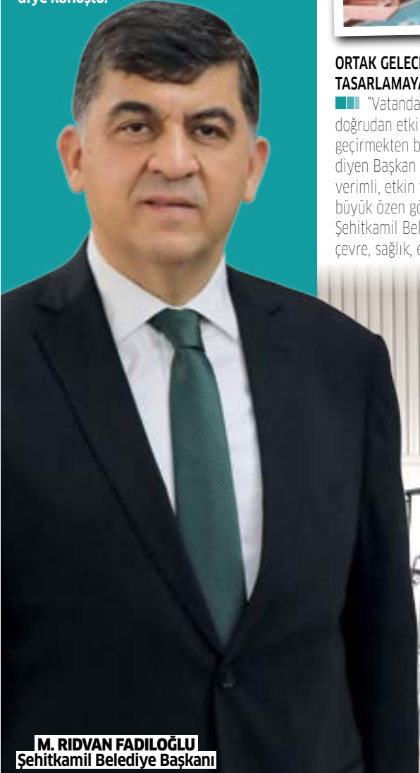
M. RIDVAN FADİLOĞLU Şehitkamil Belediye Başkanı

■ Dışarıya olan bağımlılığı azaltmak ve kendilerine yetecek sürdürülebilir bir yapı oluşturmak adına çok önemli yatırımlar gerçekleştiren ve zaman içerisinde özellikle ekonomik olarak çok büyük kazanımlar elde etmeyi başaran Şehitkamil Belediye Başkanı Rıdvan Fadıloğlu, "Kurumsal yapı ve sistematik işleyişin sağlanması adına ekip arkadaşlarımızla önemli başarılar elde ettik. Şu anda şahıslara değil, sisteme bağlı çalışma noktasında her taş yerine oturdu. Teknolojik imkan ve yenilikleri kullanarak vatandaşımıza verdiğimiz hizmet kalitesini artırma hedefiyle çalışmaya devam ediyoruz" diye konuştu.