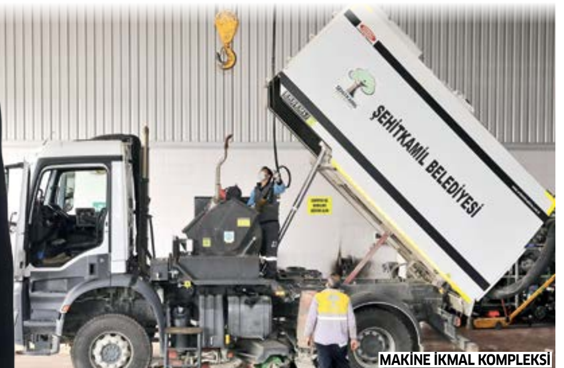
MAKİNE İKMAL KOMPLEKSİ

ve daha birçok alanda ortak geleceğimizi en iyi şekilde tasarlamaya çalışıyoruz. Şehitkamilliler, her şeyin en iyisine layık. Halkımızı, hak ettiği yeni projelerle buluşturmak adına tüm gücümüzle çalışmayı sürdüreceğiz. Millete hizmeti, kendisine düstur edinmiş bir anlayışla bundan sonraki süreçte de çalışmalarımıza aynı aşk ve şevkle devam edeceğiz" açıklamasında bulundu.