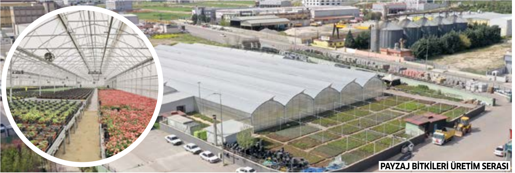
PAYZAJ BİTKİLERİ ÜRETİM SERASI