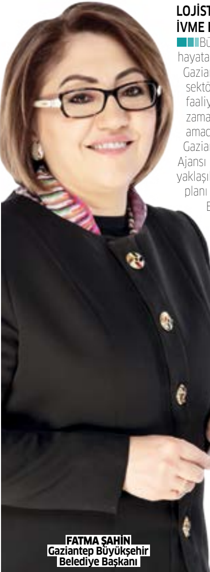
FATMA ŞAHİN Gaziantep Büyükşehir Belediye Başkanı